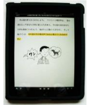
ipad 再生画面『LD・学び方が違う子どものためのサバイバルガイド』（明石書店）より