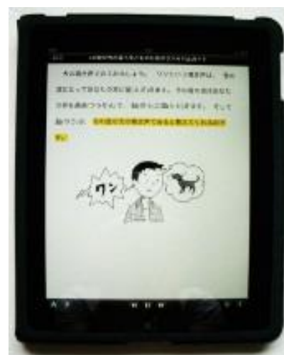
ipad 再生画面『LD・学び方が違う子どものための サバイバルガイド』(明石書店)より